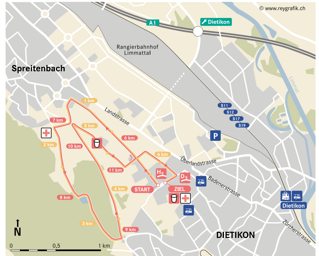
Kategorie A-J/Y/Z (2 Runden)